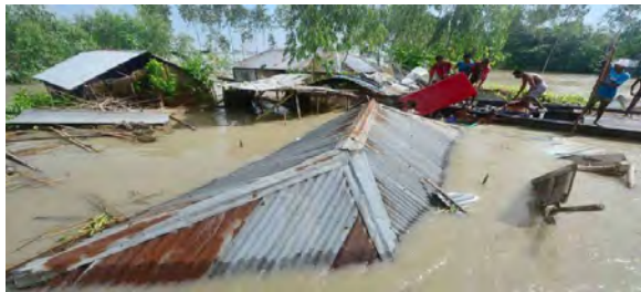
village emporté par les eaux après la rupture d'une digue

de gens a été affectée, notamment les 2/3 des habitants de l'Upazila de Chilmari dans le district de Kurigram, et plus de la moitié des