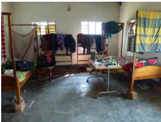
Chambre des paramedics dans la partie habitation du Centre