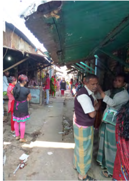
Rue principale du bordel avec ses boutiques ; prostituées à gauche et au fond en attente de clients et l'échoppe du coiffeur pour hommes à droite

Nous avons eu envie de vous la faire connaître et avons demandé par l'intermédiaire des gens de Savar qu'elle nous parle de sa vie et de son métier. Voici ce qu'elle a raconté à la personne de GK qui l'a interviewée pour nous.