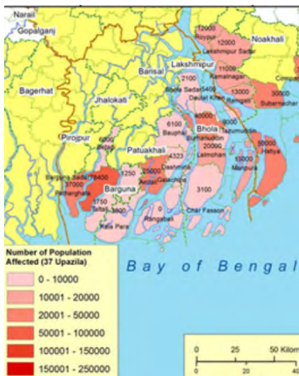
Régions sinistrées (du rose au rouge de milliers de à centaines de milliers de familles)

500.000 personnes ont dû être évacuées avant l'arrivée du cyclone Roanu qui a ravagé la côte sud et la côte des CHT du 21 au 23 mai, endommageant 80.000 maisons, tuant 20 personnes. Le gouvernement a distribué des vivres et a confié à BRAC l'assistance aux populations des zones sinistrées de Patuakhali et à Plan International celle de Barguna.