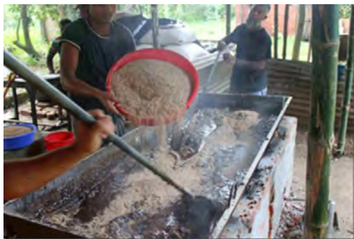
Ajout de sel, de carbonate de calcium et de balle de riz dans le mélange de mélasse et d'urée chauffé

habitants de 4 autres Upazilas dans les districts de Kurigram et Jamalpur. Les récoltes ont été totalement détruites sur 31.600 hectares et partiellement sur plus de 9.000 hectares. De nombreuses digues sont détruites ou endommagées sur des dizaines de km. Plus de 250.000 maisons endommagées ou détruites, et plus d'un millier d'écoles ont dû fermer. Latrines et puits profonds sont hors d'usage en de nombreux endroits. Le gouvernement a procédé à des distributions de nourriture, de semences, et d'argent pour les plus démunis et a appelé à l'aide les ONG et la société civile.