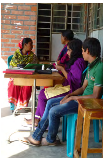
Les paramedics enregistrent une patiente