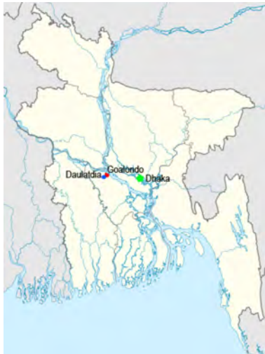
Daulatdia et le port de Goalondo à 100 km de Dhaka (Savar est en limite NW de Dhaka)

Le Centre de santé de GK (sous-centre sans médecin résident) est installé dans le gros bourg de Daulatdia, terminus de la ligne de train qui vient de Khulna et à quelques km du port de transbordement de passagers et de marchandises sur le Brahmapoutre.