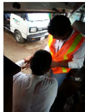
Une paramedic de GK soigne un brûlé léger

À Tongi, banlieue industrielle au nord-ouest de Dhaka où GK a un petit hôpital et une clinique mobile, l'explosion d'une chaudière dans une usine de 4 étages a déclenché un incendie puis l'écroulement de la partie centrale de l'immeuble, entraînant la mort de 31 personnes et blessant 70 ouvriers plus ou moins gravement brûlés. Des produits chimiques étaient entreposés au rez-de-chaussée. L'usine fabriquait des emballages plastiques notamment pour British-American Tobacco Bangladesh, et Nestlé Bangladesh.