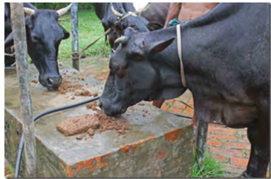
La nourriture est donnée aux bovins sous forme de blocs moulés

Notre bureau a tout de suite envoyé une lettre d'intention de 30.000 euros, immédiatement acceptée par le Bureau des ONG. Et en parallèle, nous avons sollicité directement nos donateurs habituels qui ont généreusement répondu.